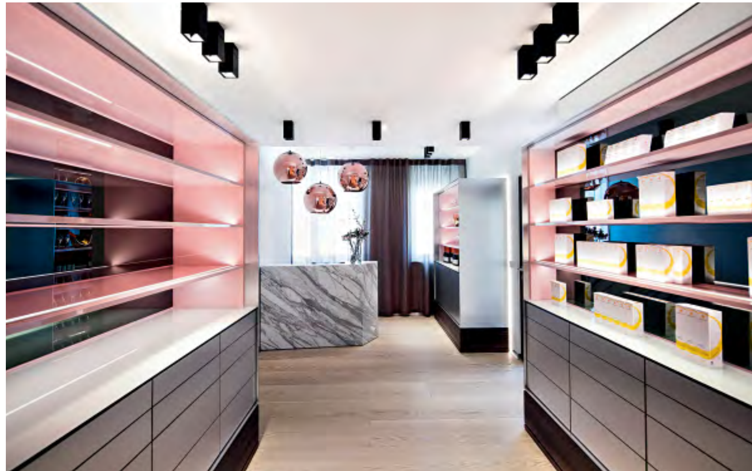
Klare Linien und Pastellfarben bilden die Basis der Raumgestaltung der Verkaufs- und Beratungsfläche. • Clear lines and pastel colours are the basis of the interior design in the sales- and consulting space.