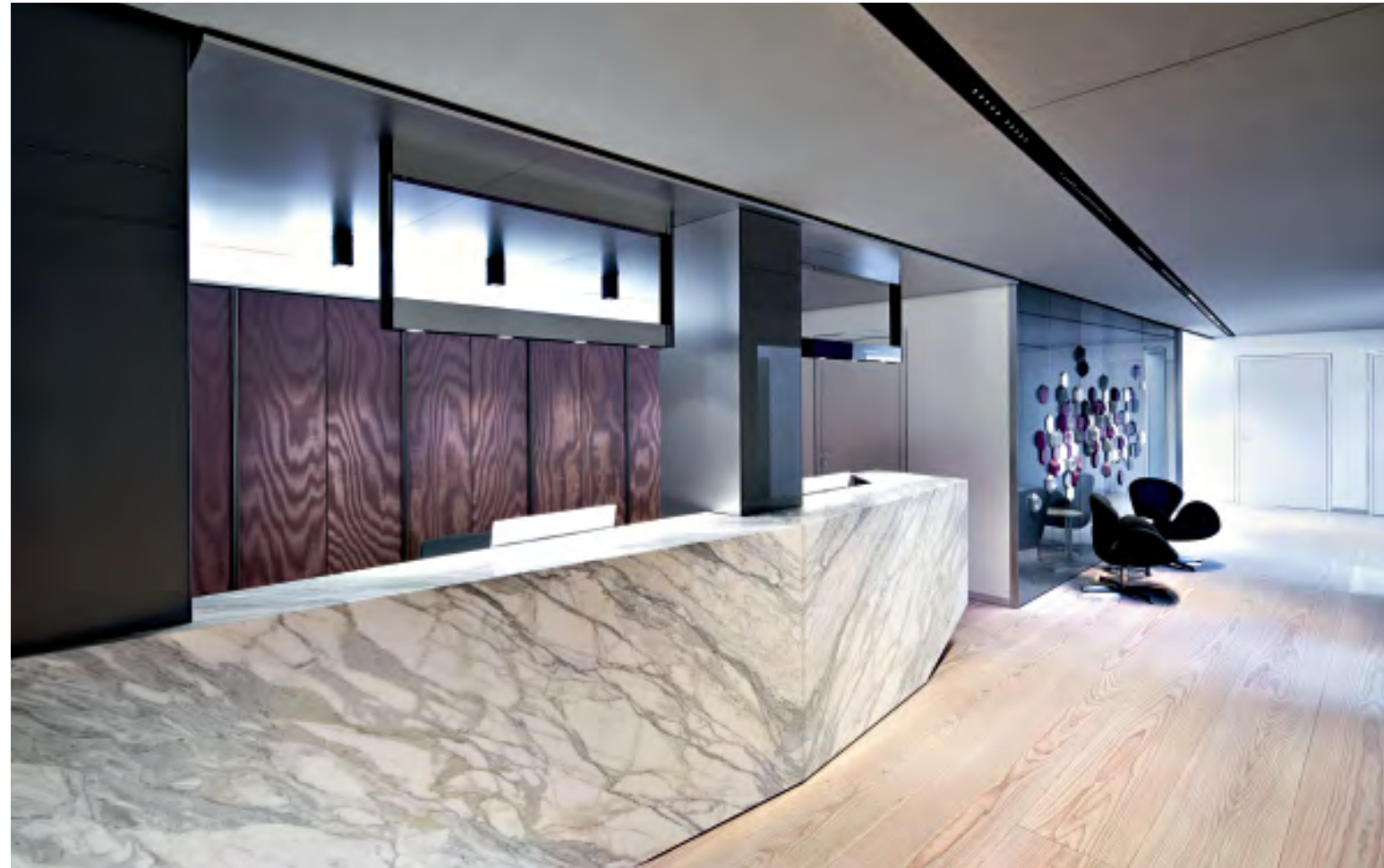
Wie in einer Hotel-Lobby werden hier die Kunden an einem ausladenden Marmortresen empfangen. • Like in a hotel lobby, here the clients are welcomed by a projecting marble counter.