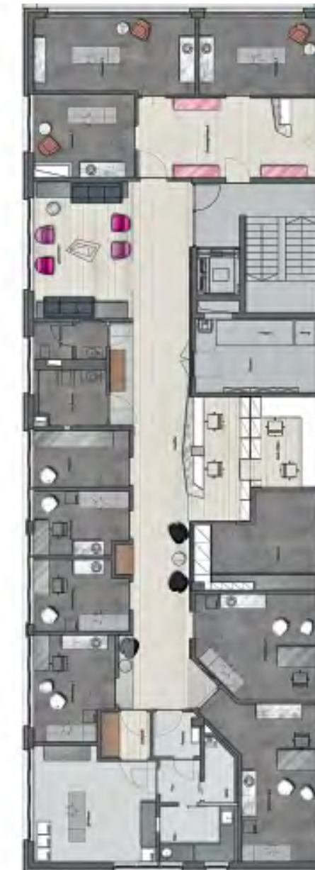
Grundriss • Floor plan